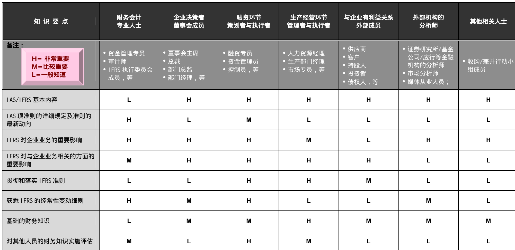
各阶层管理人员 IAS/IFRS 培训需求对比表